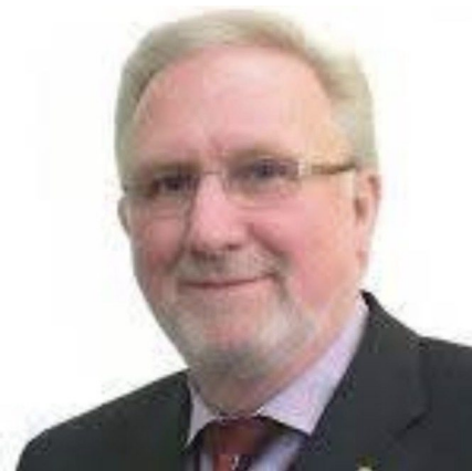
エリック・ブレイオム