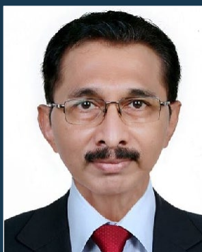
マメン・ウメン・ コチュカリカル インド・中央トラヴァンコール区