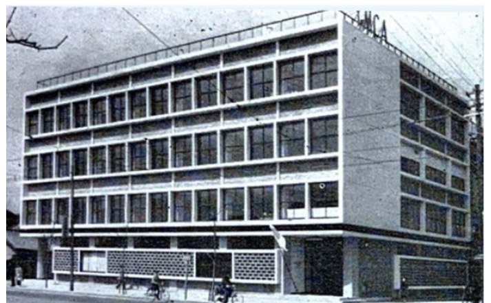
大阪YMCAの新ユースセンタービル

結論として世界中のワイズメンズクラブは、地元の地域社会のみならず、世界の友人たちを支援しているのです。