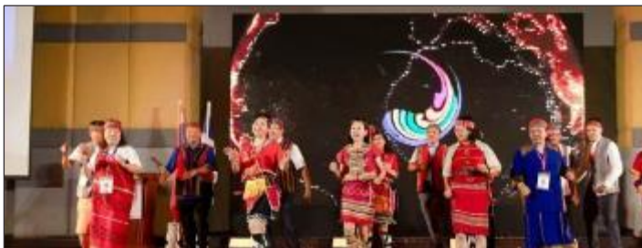
台湾区による先住民族の踊り