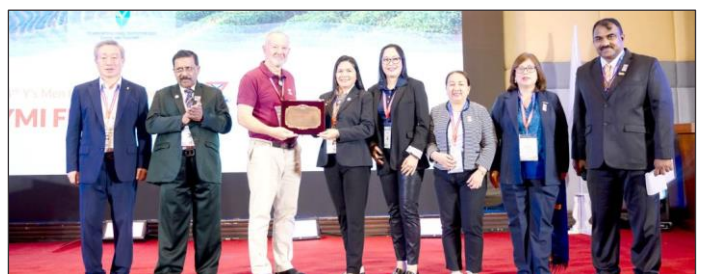
RAHAフィリピンクラブへの2022/23国際CS賞の授賞式