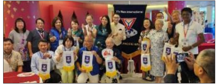
2023/24地域議会メンバーへの感謝状贈呈