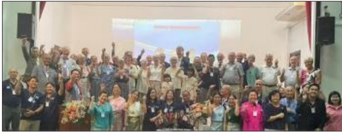
YMIフェスティバルでのパフォーマンス