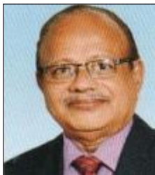
V・S・ラハルクリ シャオン インド