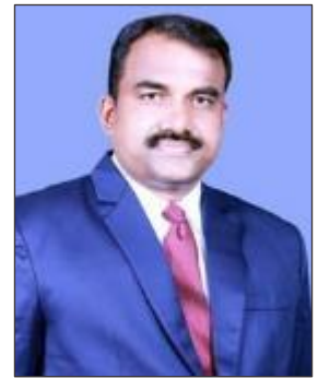
ジョース ヴァルギース 国際書記長