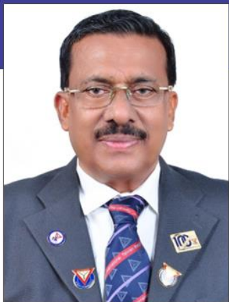
A・シャナヴァスカーン 国際会長