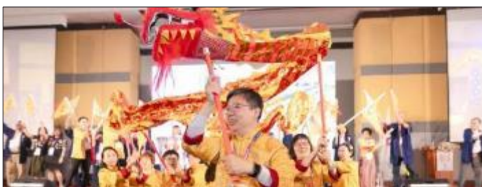
南東アジア区(香港部)のドラゴンドダンス