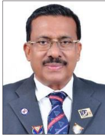
A・シャナヴァスカーン 国際会長