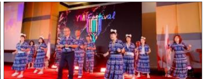
チェンマイクラブのラインダンス