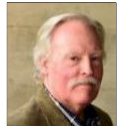
ダグラス・ジョーンズ 米国