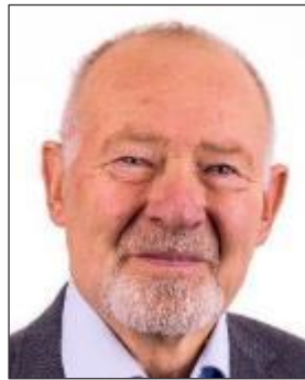
ウルリック ラウリドセン 直前国際会長