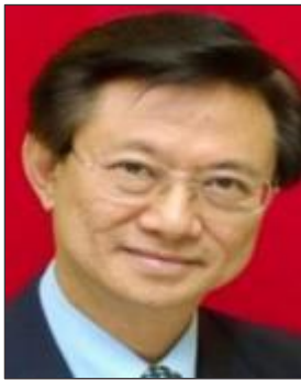
エドワード オン 次期国際会長