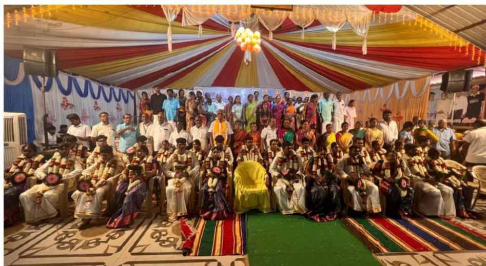
コインバトルワイズメンズクラブが企画した注目すべきCSプロジェクト 14組の貧困カップルのための盛大な結婚式 インド地域、南インド区