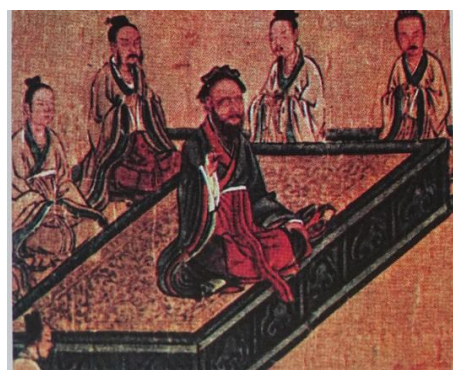
孔子が弟子に教えているところ 台北・故宮博物館.