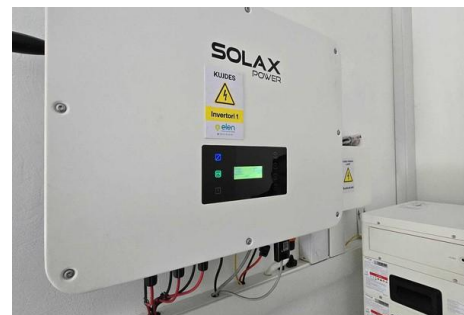
コソボYMCA グリーンプロジェクト 太陽光パネル