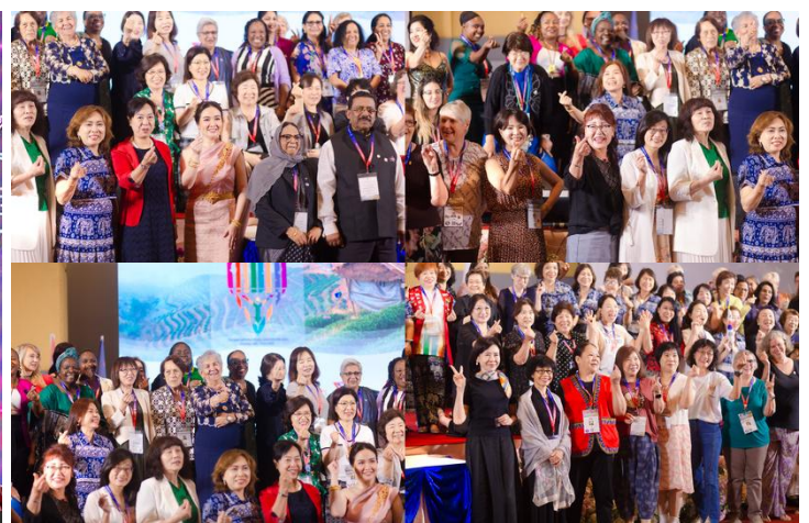
2024年タイ・チェンマイ国際大会 に参加の女性リーダーたち