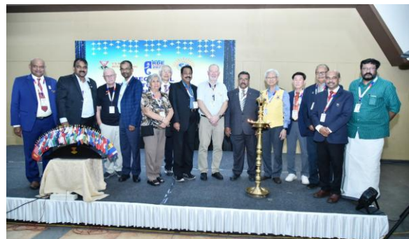
次期理事サミット 2025年2月11-14日 インド ケララ