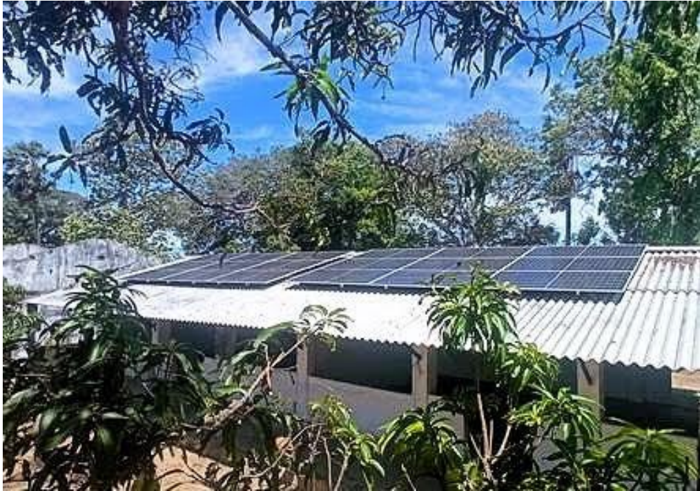
スリランカの太陽光パネルプロジェクト

スリランカでは、2025年1月にこのプロジェクトが開始され、承認された資金の50%が提供されました。しかし、配電が国政の管轄下にある地域にソーラー発電が設置されるため、政府の承認を得る必要があります。2月に遅れが生じました。このプロセスには通常 2から4カ月かかりますが、このプロジェクトは、今年度中に完了することが期待されています。