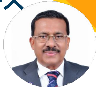
A・シャナヴァスカーン 2024/25 国際会長