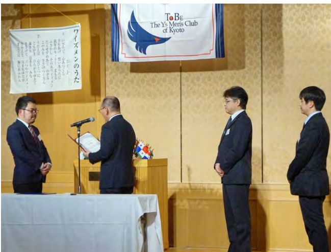
1月18日(木) 京都トゥービークラブ 1名入会式