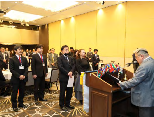
12月6日(水) 京都グローバルクラブ 2名入会式