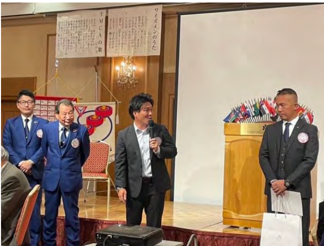
11月22日(水) 神戸ポートクラブ 1名入会式