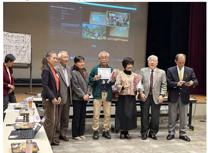
11月21日(火) 京都キャピタルクラブ 1名入会式