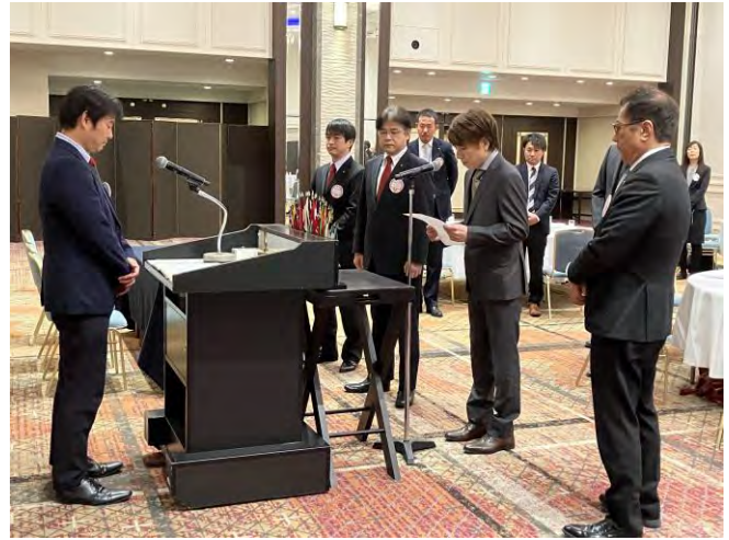
11月22日(水) 京都パレスクラブ 1名入会式