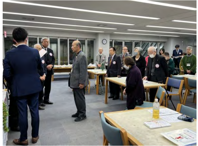
12月5日(火) 大阪サウスクラブ 1名入会式