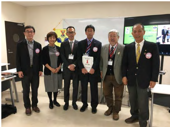
11月22日(水) 神戸ポートクラブ 1名入会式