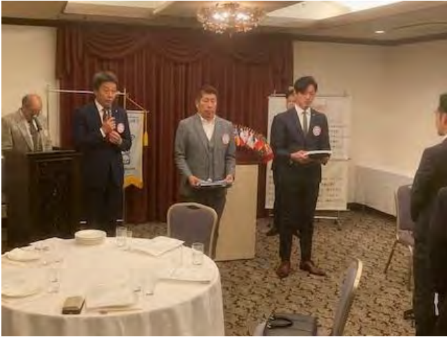
12月2日(土) 京都洛中クラブ 2名入会式