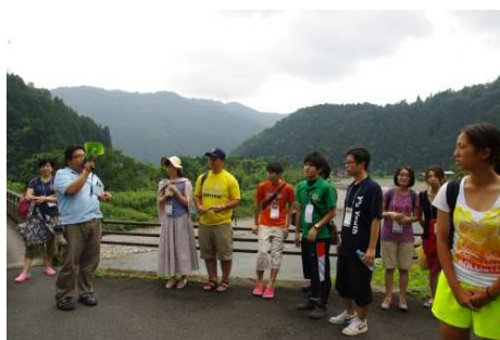
(ガイドによる説明を聞いている場面)