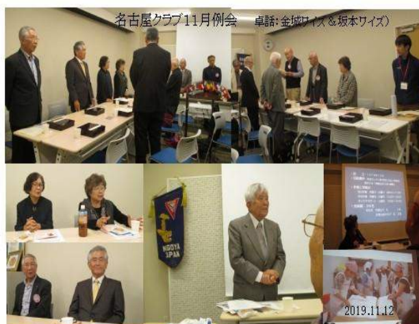
▲DBC（和歌山紀の川C）メンバーを卓話講師 に迎えての交流 @名古屋クラブ

今月の聖句 2020年1月 マタイによる福音書 2章 12節 別の道を通って自分たちの国へ帰って行った。