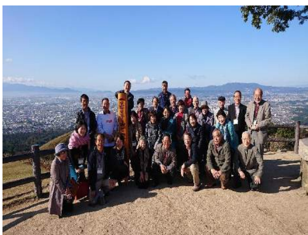
▲御殿場C・名古屋東海C・奈良C 総勢35名 でトライアングルDBC交流

各クラブでIBC・DBC交流を楽しんでおられることと思います。交流はワイズの醍醐味、違う文化に触れることや、多種多様な考えを知る事で、人は豊かに成長するのではないかと思います。