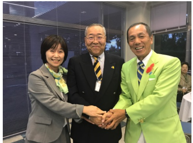
雨にも負けず、大盛会！感謝です。