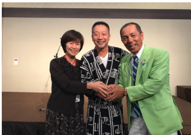
大役を終えてホッと！