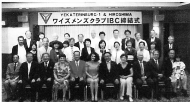
広島クラブIBC締結式 2015.8.6

8月6日は原爆記念日ですが広島クラブとロシアエカテリングブルグクラブとのIBC締結式が執り行われました。部長として立会人として貴重な経験をさせていただきました。西中国部各クラブも様々なクラブとの交流を通じてIBC、DBCの締結がクラブの活性化になると思います。