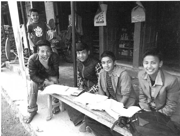
友達と一緒に勉強に励む(ネパールの山村で)