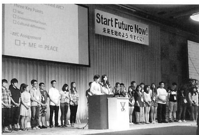
AYC報告アジア地域大会京都