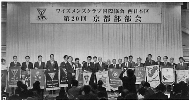
バナーが勢ぞろいして開幕です