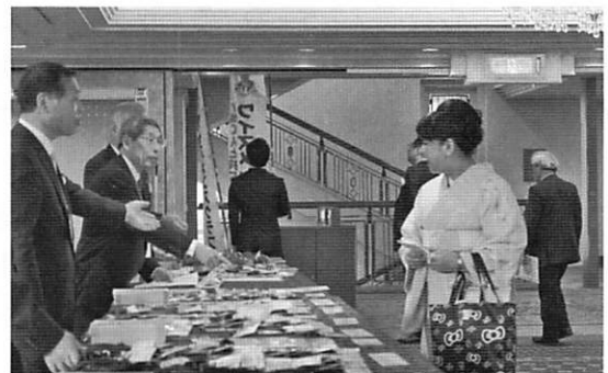
受付に忙しいホストクラブのメンバー

1つめは、11月1日に開催された京都部部会についてです。夏にアジア地域大会が京都で開催されたこともあり、大会疲れで人が集まるか心配でした。なるべく夏から期間を離してということと、ホテルという格を落とさずに廉価でみなさんに提供することを頭においてのスタートです。ホストの京都クラブは何度も実行委員