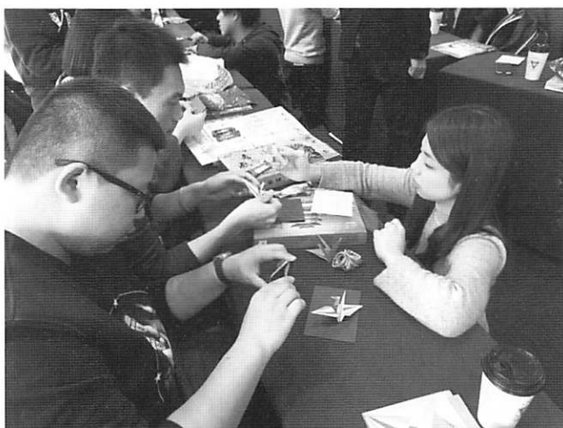
中国の共に折鶴を教える(日中韓YMCA平和フォーラム)

れました。総主事以外はすべて 20 代のスタッフによって運営され、海外からも多くのユースがワークキャンプなどで訪れます。1980 年代に内戦と大虐殺を体験したカンボジアは、担い手となるのはユースしかいないと言っても過言ではありません。アンコール・ワット遺跡のあるシェムリアップでは、YMCA のチャイルドケアに通う母子家庭の子ども達に会いました(11/23 ~ 25)。夕方からはトク