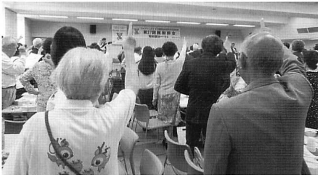
阪和部会部会・「阪和部は一つ」を唱和