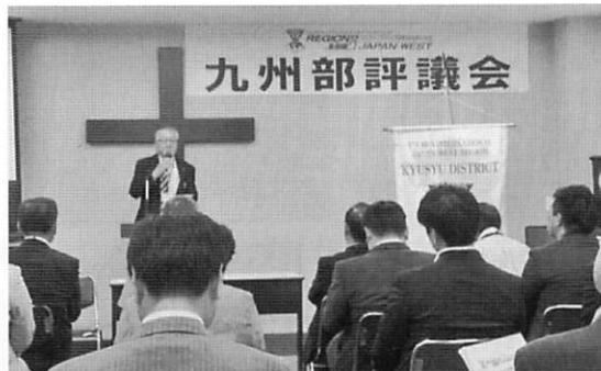
九州部 EMC シンポジウムと入会式(7月5日)