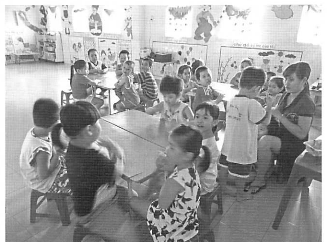
YMCA幼稚園の子ども達(ベトナム)

ンでできた薄暗い家の中で、深夜に仕事を終える母親の帰りを待ちます。ネパールでは、首都カトマンズや山奥の農村を訪ねました(11/28 ~ 12/2)。学校も被災して子ども達の教育の場が整わないままになっています。山道を数時間かけて歩いて学校に通う子ども達に、いち早く新しい学校の再建が望めます。タイ・チェンマイで行われたアジア・太平洋 YMCA 会議(12/3-6)では、新体制に替わったアジア・太平洋 YMCA 同盟の今後 4 年間の方針について話し合いがなされ、ユース世代に「サーバントリーダーシップ」が養われること、つまりリーダーシップのあり方をイエスから学ぶことが大きくクローズアップされました。そして再び中国・南京。日中韓の YMCA から 80 名が集まった平和フォーラム(12/19-23)では、これまでの 3 国間の平和への取り組みをあらためて整理し、次世代に引き継ぎ、そしてユースの手で新しい平和への取り組みを創ることが決意されました。日本からのユースの語学力、質問力、そしてリーダーシップの高さは私たちの想像を遥かに超えていました。