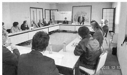
びわこ部 EMC シンポジウム(12月13日)