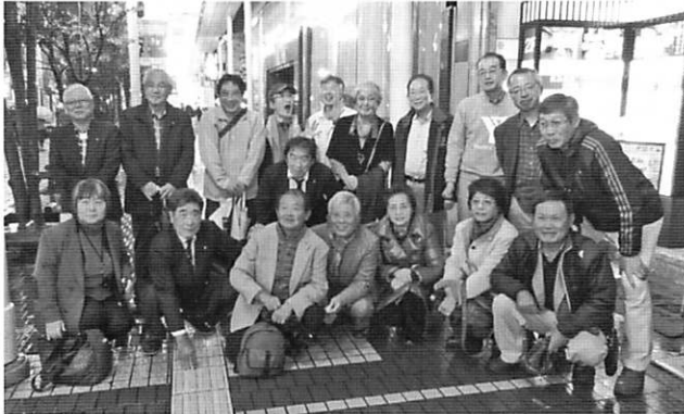
東北復興応援ツアー・仙台3クラブメンバーと共に