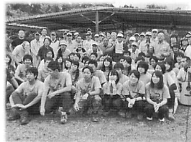
風の谷ワークキャンプ

多賀にある滋賀 YMCA 教育キャンプ場「風の谷」にて 6 月 28 日 (日) 好天で快い風の下びわ部のメン、メネット、リーダー、YMCA 職員らが一同介して来るキャンプ開設の為行われたワークが今期びわこ部スタートの統一事業です。今回はびわこ放送 TV が一日取材に来られ、7 月 8 日の「キラリン滋賀」の番組にて放映され、広報の一翼を担っていただきました。