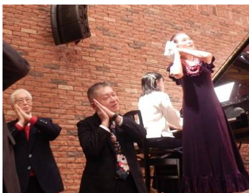
宝塚クラブ主催のXマスイベントでフラダンスに興じる理事