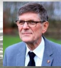
国際会長 ジェイコブ・クリステンセン

このニュースは、1 年を通して、毎月の寄稿記事や最新状況の報告によって、YMI 会員の皆さまに情報をお伝えするためのものです。このニュースをお受け取りになった際には、できるだけ多くの会員の皆さまに転送いただければ幸いです。メンバーは、何も受け取らないよりも、重複して 2 部を受け取る方が良いでしょう。