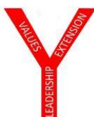
ジェイコブ・クリステンセン 2020-21 国際会長

各委員会やタスクフォースでは素晴らしい活動が行われています。ジュネーブに IHQ のための不動産を購入するための資金をどれだけ集められるでしょうか？ PWAF レガシー基金への新たな取り組み、100 周年記念行事、2022 年にハワイで開催される国際大会、「YMI - 2022 年とその先に向けて」のアンケート調査、そして、種々のマニュアルの整備など…。私たちは、全速力で動いている「運動」です。