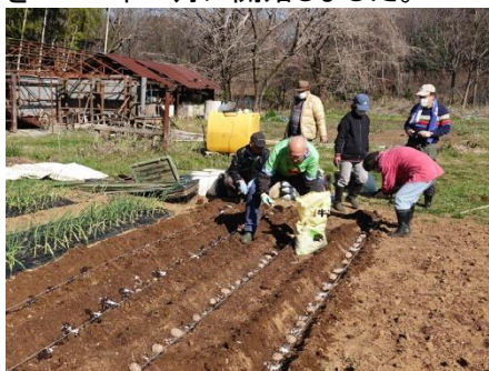
ジャガイモの植え付け

私たちのクラブは、2016年にチャーターされましたが、CS活動のひとつとして、新しいメンバーを惹きつける手段として、そしてまた、クラブメンバーが共に働くことによってクラブの結束を固めるため、クラブの農園を2017年8月に開始しました。