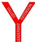
ジェイコブ・クリステンセン 2020-21 国際会長

国際会長ニュース 11月号へようこそ。今号では、アレキサンダー奨学基金 (ASF)、IHQ からのニュース (次期国際会長選挙の候補者、ポータルバズ、新型コロナウイルス、新しい研修教材) の記事が掲載されています。「良い話を伝えよう」では、りんご狩りのクラブ活動、Week4Waste (ゴミのための週) の活動事例を紹介しています。新型コロナウイルスの蔓延のため、デンマークからの出張はありませんでしたが、地域会長、次期地域会長、国際事業主任、委員会、タスクフォースとの会合や地域、区、部レベルの多くのバーチャルミーティング等、Zoom でのコミュニケーションが絶え間なく行われている忙しい時期です。